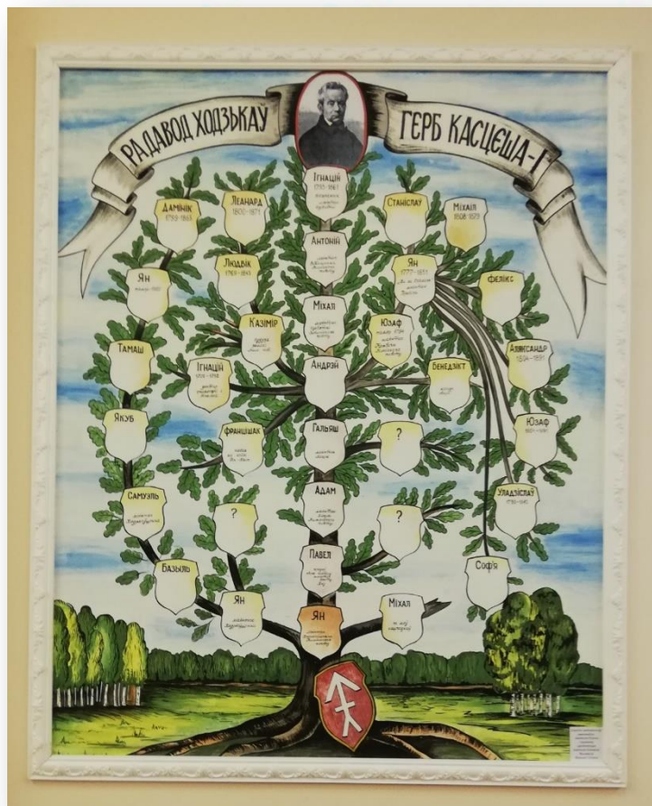
Прыклад з радаводу Ходзькаў

Магнаты і заможная шляхта складалі радаводы па мужчынскай лініі, каб паказаць ці даказаць старажытнасць свайго роду і пахваліцца перад суседзямі высокімі пасадамі продкаў.